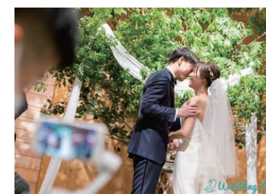
今年11月にTRUNK BY SHOTO GALLERYで行なわれた挙式をWeddingLiveにて配信。リアルゲスト60人、ライブ配信は90人規模で行なわれた。安定した配信を実現するため、iPhoneをスタビライザーにセットして撮影した

て、挙式や披露宴などのライブ感を、離れた場所にいるゲストにも伝えられるアプリ。同社はさまざまなケースで円滑にライブ配信ができるよう技術的な課題を一つずつクリアしてきている。式場ごとに異なるネット環境や、オペレーションの整備についても、同社が積極的に式場を支援していると野村氏は語る。