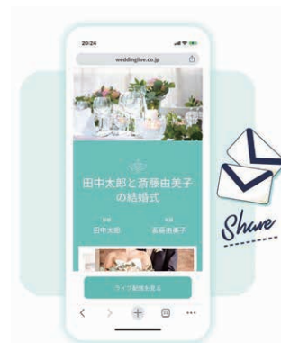
ゲストが受け取る招待状ページ。URLを受け取った親族や友人のみが参加することが可能