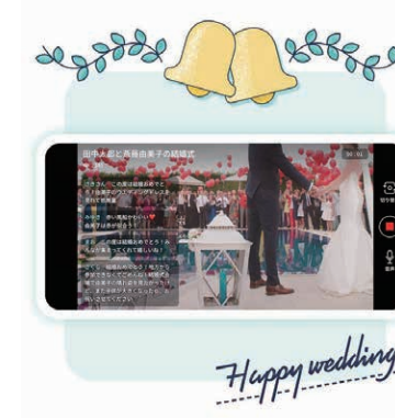
ライブ配信時の画面。スマホと電波さえあれば、どこからでもライブ配信が可能

んありますが、結婚式に特化したものはまだまだ少ないと思います。機能面では新郎新婦が作った招待状を送り、ゲストは送られてきたURLからそのまま当日はスマートフォンなどからライブ結婚式に参加できます。また、オンラインで参加されたゲストからも、新郎新婦へご祝儀をお贈りできる『オンラインご祝儀』の機能も盛り込んでいます」