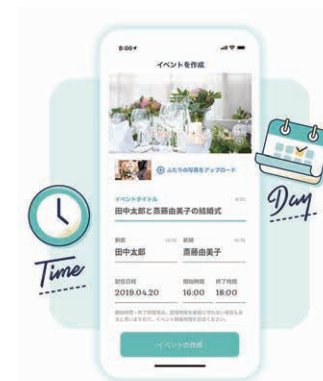
ライブ配信ページの作成ページ。ここで作った招待URLをゲストに送信する