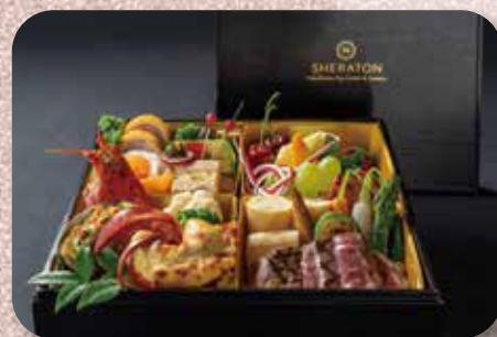
特集で取り上げた各社が宅配する婚礼料理